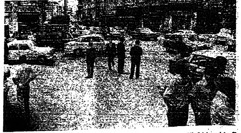
شارع بشارة الخوري حركة ناشطة للمواطنين والسيارات